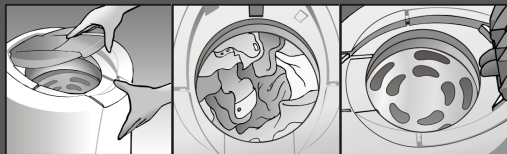
1 - Puxe a trava da tampa