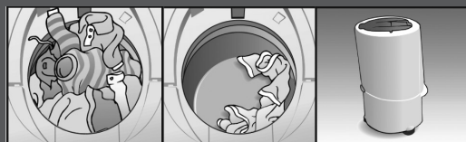
Excesso de Roupas